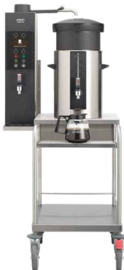
+ Type - S (Type - C er velegnet til 2 beholdere)