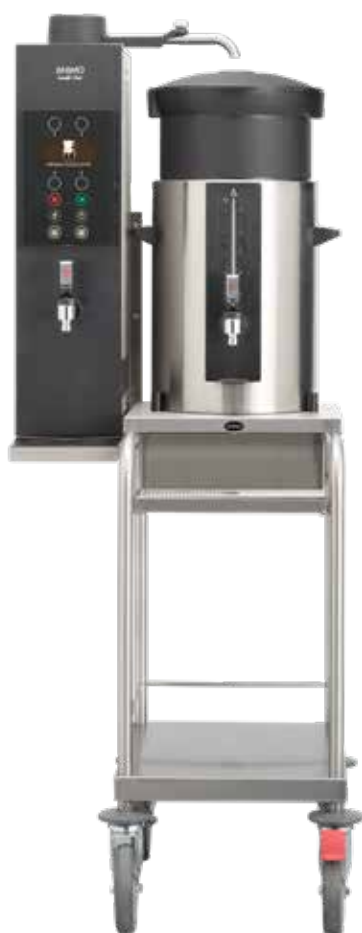
+ Type - J